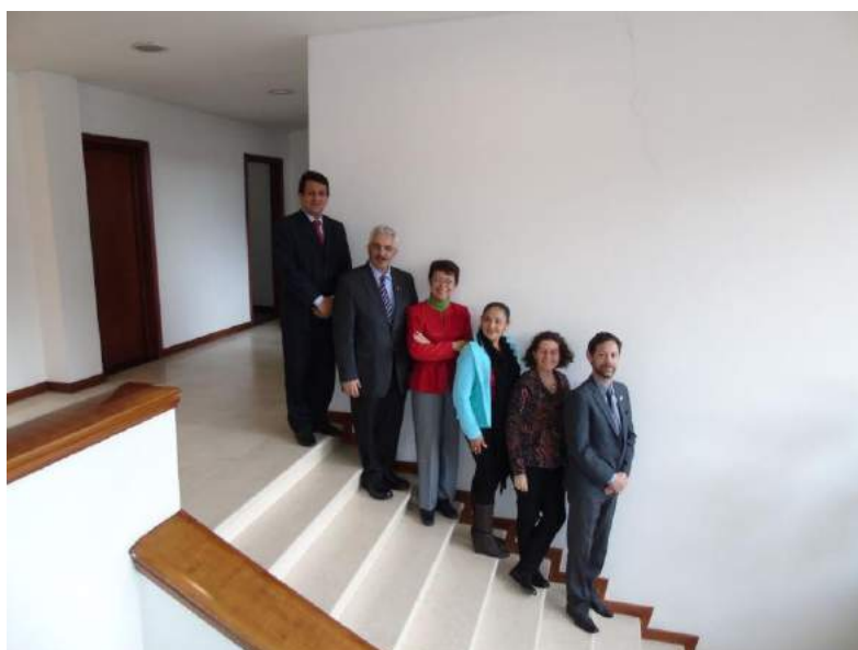
Integrantes del Comité Ejecutivo de la RIACES

Para ver las experiencias completas visite: www.riaces.org